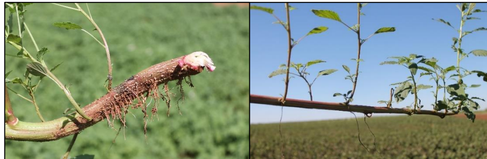
Foto 5. Vegetatiewe groei wat waargeneem is op Palmer amarant plante wat uitgekoffel is en daarna in die land gelaat is