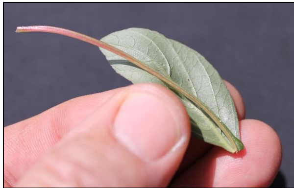
Foto 3. Die blaarsteel van sommige blare op Palmer amarant is betekenisvol langer (tot 3 cm en langer) as die blaarskyf