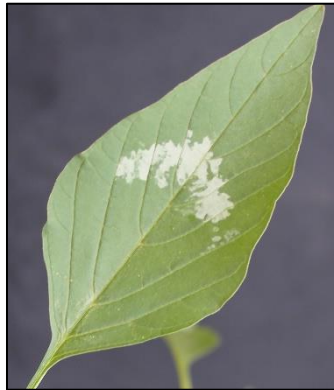
Foto 1. Spiesvormige blare en wit V-vormige watermerk wat sigbaar is op sommige, maar nie alle plante nie; sommige plante het die merk en ander plante glad nie